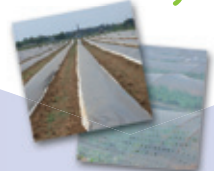
Paillage, hors-sols, solarisation, petits tunnels