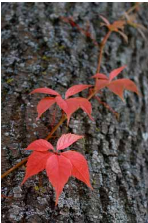
« Ascension. Liane grimpante à Vaugneray » Bruno Simonard