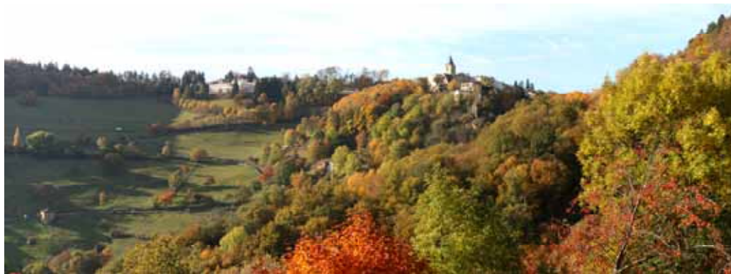
« Yzeron en automne... Un feu d'artifice de couleurs » Antonio Gonzalez Prix édition