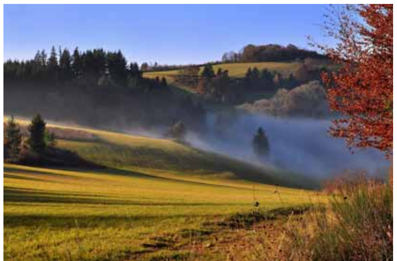
« Au-dessus du froid à Yzeron » Nicolas Paturel