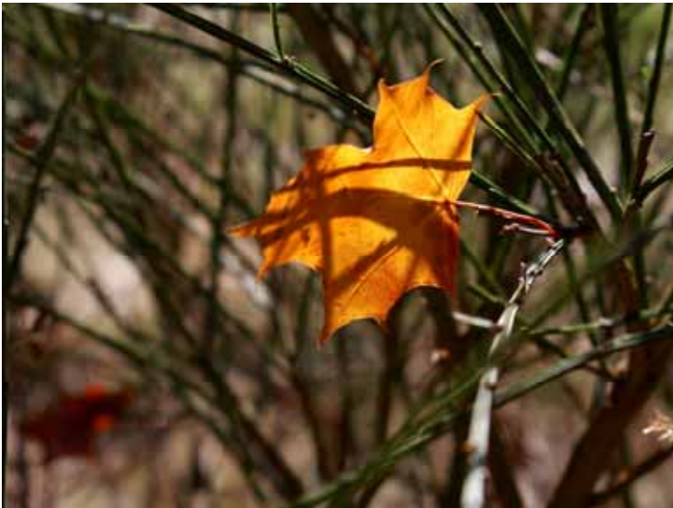
« Feuille d'automne. Feuille d'érable dans les genêts » Bruno Simonard