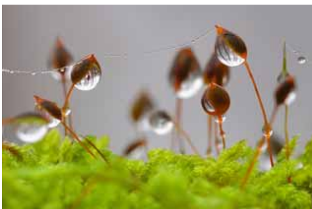
« Reflets sur gouttes de mousses à Py Froid » Marie Paturel - Prix spécial jury