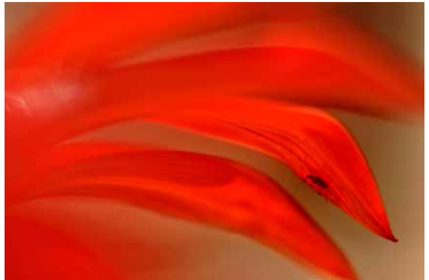
« Yzeron de rouge vêtue » Léa Paturel