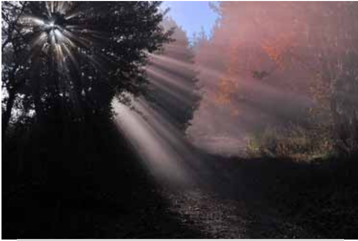
« Yzeron, rayons au-dessus du Plat » Nicolas Paturel - 1er prix