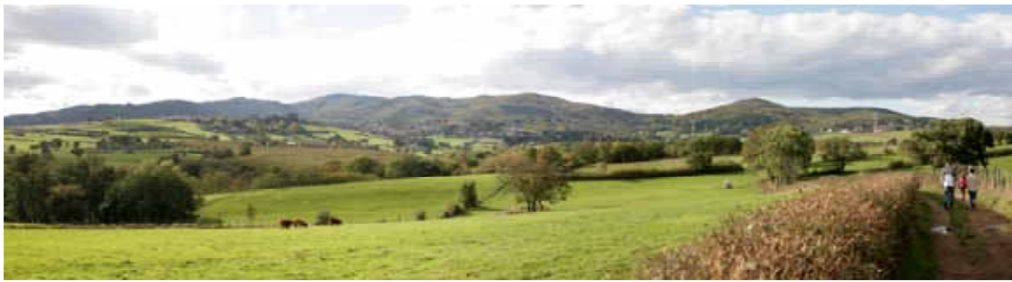
« Dans un écrin de verdure, des animaux et des hommes cohabitent ensemble » Antonio Gonzalez