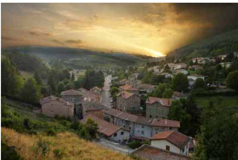
« Yzeron en été » Serge Strenikoff