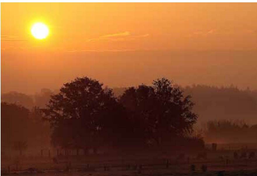
« Lever sur Brindas rural » Jacques Mercier