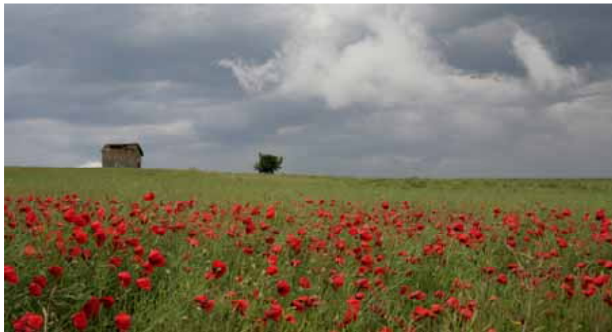
« Cabanon et champs de coquelicots vers Brindas » Antonio Gonzalez - 3eme prix