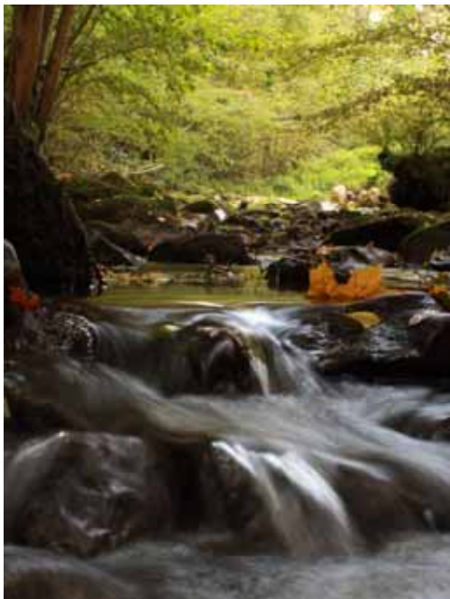
« Yzeron magique à Pont Pinay » Bruno Simonard