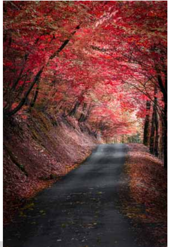
« Le chemin rouge. Jolie route ombragée à Thurins » Emmanuel Le Guellec